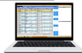
【 LOGI-Cube 】