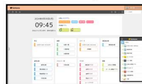
【 kintone 】

コモンコムDX推進サービスは、サイボウズ社の「kintone」を活用し、お客様の課題解決やDX化を支援するサービスです。業務効率の向上やデータの可視化を通じて、よりの確な経営判断をサポートします。当社「LOGI-Cube」と連携することでより一層一元的で効率的な業務が実現可能となります。この機会にkintoneを試してみたいお客様、ぜひご来場ください！